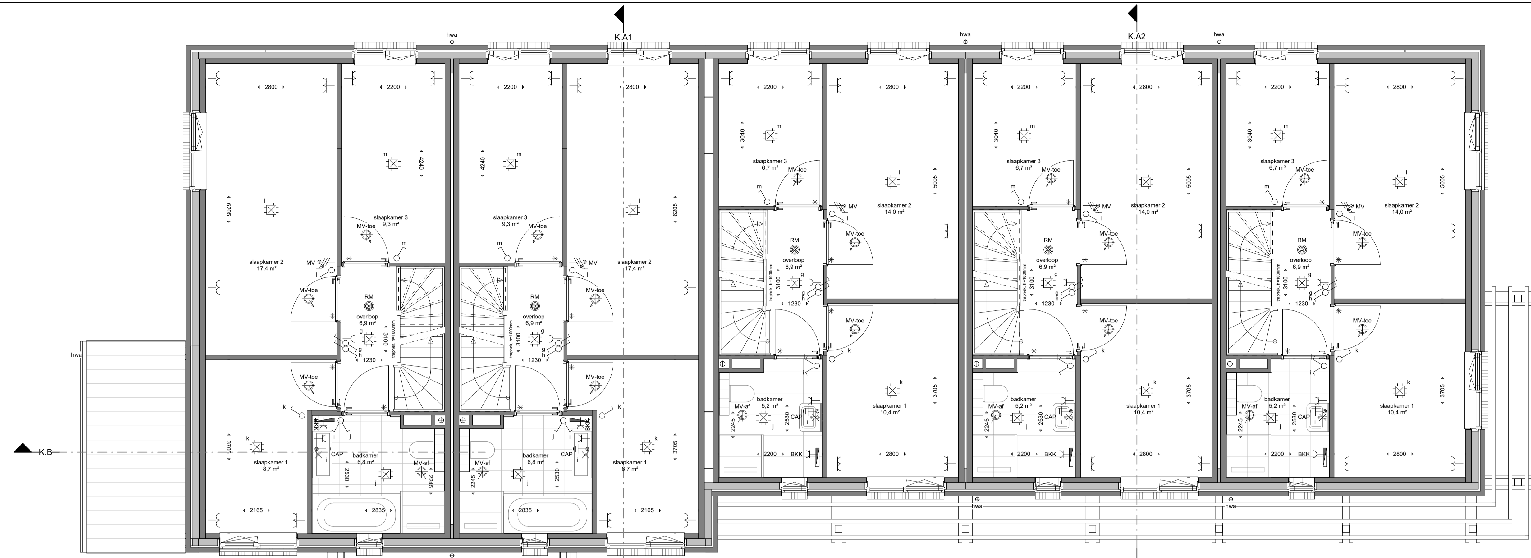
1e Verdieping Schaal 1:50